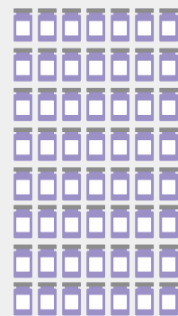
+ AstraZeneca ≈ 5,6 Mio.

Fragen & Antworten, Videos, Downloads und Newsletter unter Corona-Schutzimpfung.de